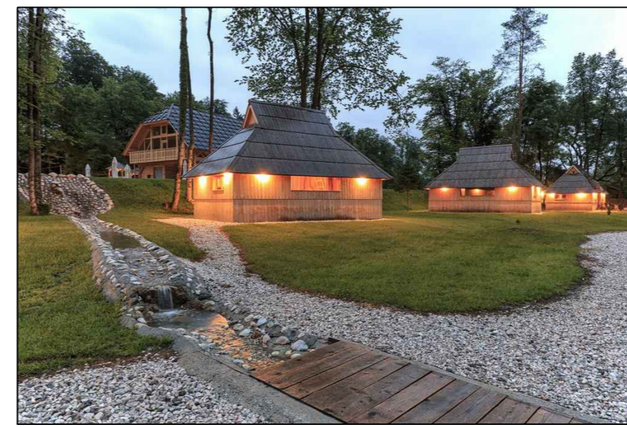
5 smještajni objekti -drvene kuće -PRIMJER