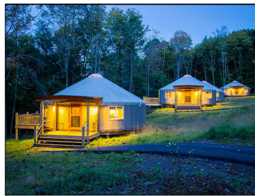
5 smještajni objekti -ŠATORI PRIMJER