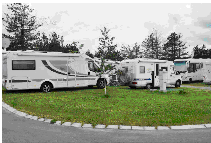
7 kamp parcele -kamperi-PRIMJER